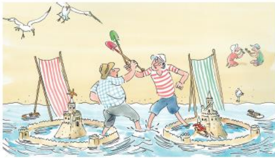
Stéphane Henrich, Châteaux de sable