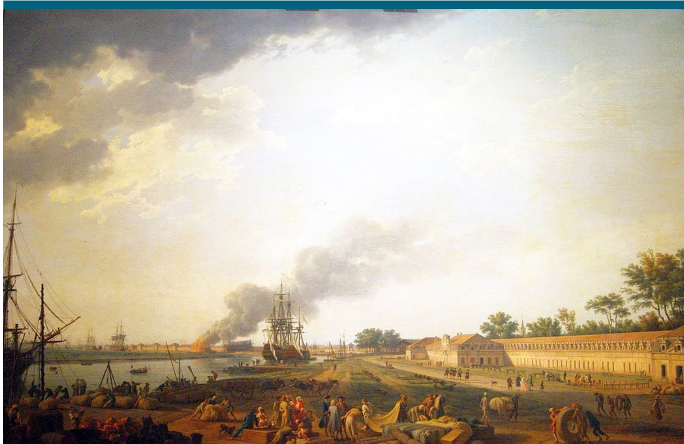
Joseph VERNET, Vue du port de Rochefort, prise du Magasin des Colonies , 1763