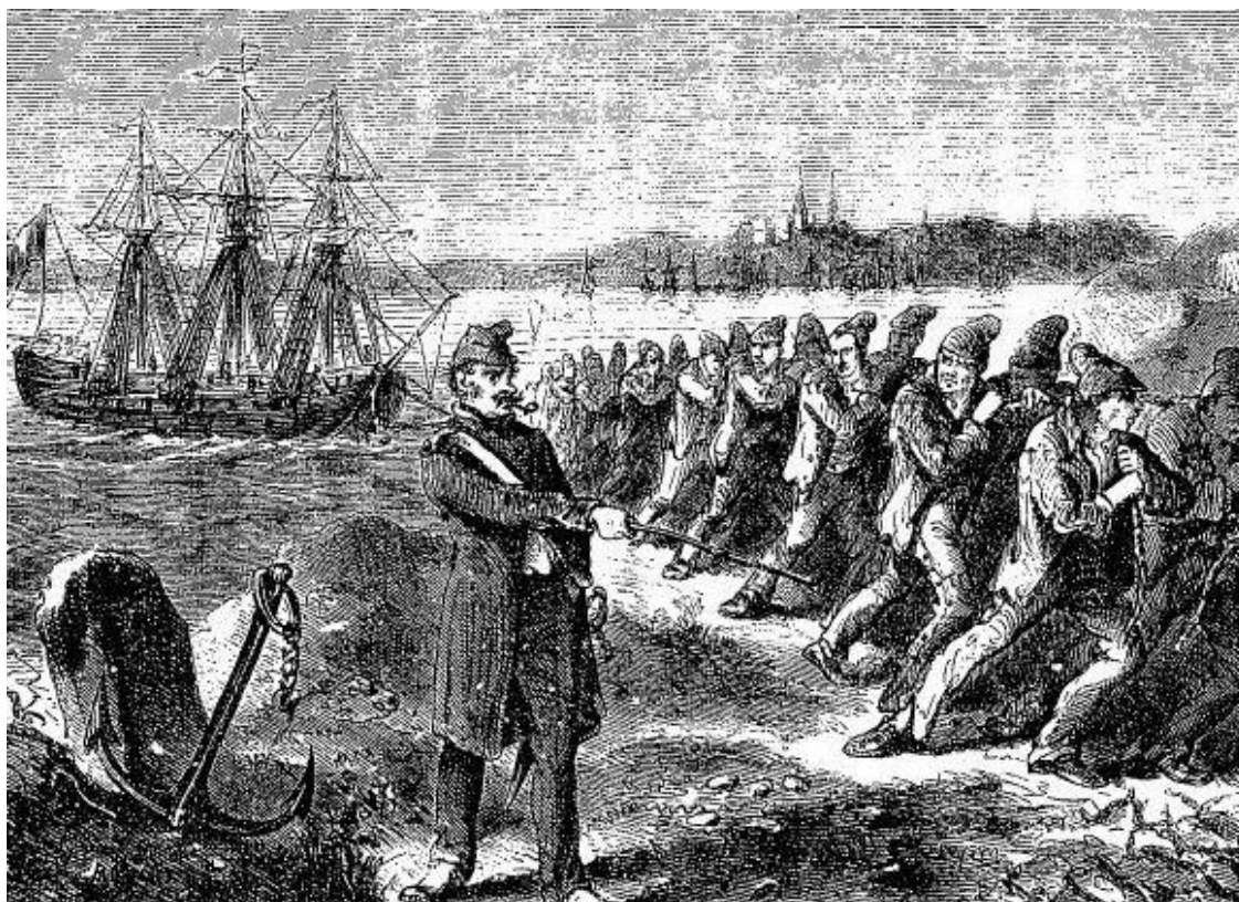
Gravure présentant une opération de halage sur les rives de la Charente, extraite de Pierre Zaccone, Histoire des bagnes depuis leur création jusqu'à nos jours , Victor Brunel éditeur, 1882

Au XVIII e siècle , c'est d'abord un hangar en bois qui est aménagé, les premiers condamnés arrivent en octobre 1766, une première extension est réalisée l'année suivante puis en 1774 des jardins sont valorisés pour compléter l'apport en produits frais des forçats afin de contenir le scorbut. Un hôpital de convalescence prend place sur le site. Jusqu'en 1775 , alors que l'activité de l'arsenal reste limitée, l'effectif du bagne varie de 550 à 700 forçats. A partir de 1776 et la guerre d'indépendance américaine dans laquelle le roi Louis XVI engage le royaume de France aux côtés des insurgés, la production de l'arsenal s'accélère. Les effectifs du bagne dépassent alors le millier (1250 en 1781). Un deuxième hangar est construit et l'hôpital est agrandi. L'aménagement définitif du corps central du bagne avec une façade en pierres d'environ 150 mètres de long est réalisée entre 1780 et 1782 .