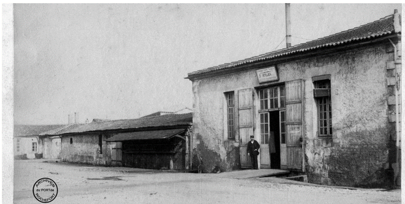
Réutilisation des bâtiments du bagne en 1882.

Les anciens locaux du bagne intègrent l'Arsenal, devenant d'une part une chaudronnerie et par ailleurs des magasins avec aménagement d'ateliers et dépôts. L'arsenal ferme à son tour définitivement en 1927. Les bâtiments sont progressivement convertis en activité industrielle (réparation navale, fabrication de dirigeables et ballons par l'entreprise Zodiac, usine d'aviation), l'ancien bagne sert alors d'entrepôts. En 1940 , plusieurs bâtiments de l'arsenal dont ceux du bagne sont occupés par les Allemands ; en août 1944 ils les détruisent en incendiant et dynamitant les écluses des formes, la corderie, une partie des bâtiments de l'arsenal et l'ancien bagne. Après la guerre, des entreprises s'installent dans les bâtiments non détruits dans la partie Sud de l'arsenal : l'entreprise Zodiac avec une production de bateaux pneumatiques et Sud-Aviation. De l'ancien bagne ne subsiste alors que des murs en ruine, définitivement détruits en 1952 lorsque la base de l'OTAN s'installe. Les ruines sont alors rasées et les bâtiments exploitables réhabilités. Toute la zone est terrassée et réaménagée. En 1964 , après le départ des Américains, cette zone sud est progressivement consacrée à l'aéronautique. L'extrémité sud est affectés à l'école des Fourriers de la Marine de 1964 à 2002.