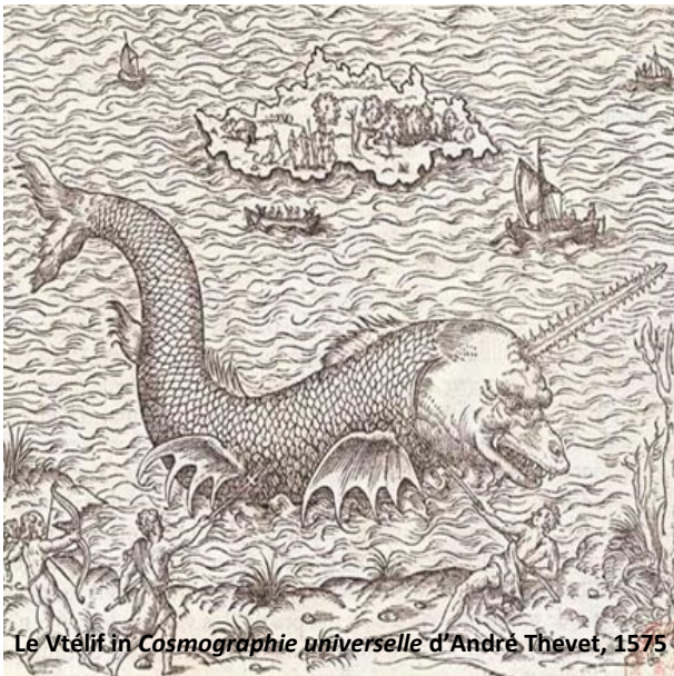
Le Vtélif in Cosmographie universelle d'André Thevet, 1575